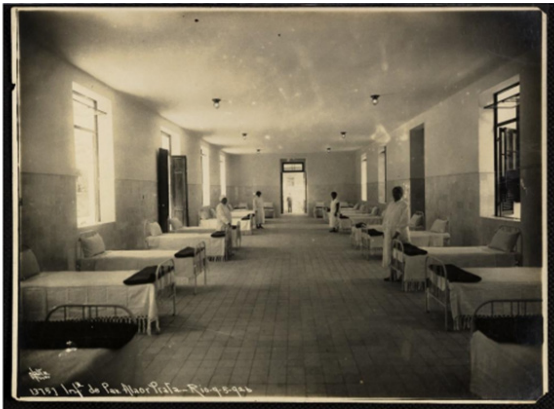
FIGURA 2 Pavilhão Alaor Prata (1925-1926) construído com o objetivo de ser um pavilhão de assistência e isolamento das pacientes tuberculosas do Hospital Nacional dos Alienados, antigo Hospício de Pedro II. Atualmente salão principal de exposição da Casa da Ciência.