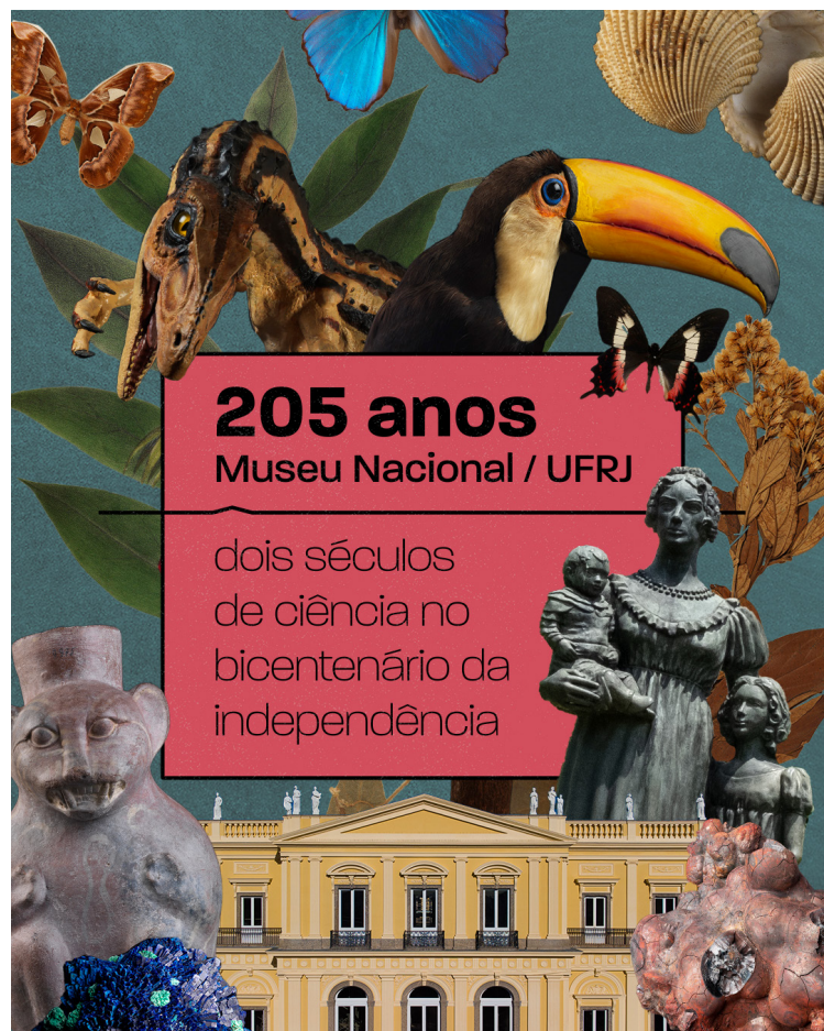
Figura 1 Identidade Visual do Aniversário de 205 anos do Museu Nacional/UFRJ – Leear Martiano

A comemoração deste ano começou a ser planejada ainda em meados de 2022, sob a coordenação do Núcleo de Comunicação e Eventos e com a colaboração dos diferentes setores do Museu, tanto administrativos quanto científicos. O evento contou com o apoio da FAPERJ, por meio do Programa de Apoio à Organização de Eventos Científicos, Tecnológicos e de Inovação no Estado do Rio de Janeiro/ 2022; e a parceria estratégica do Projeto Museu Nacional Vive – cooperação entre UFRJ, UNESCO e Instituto Cultural Vale, pela reconstrução do Museu.