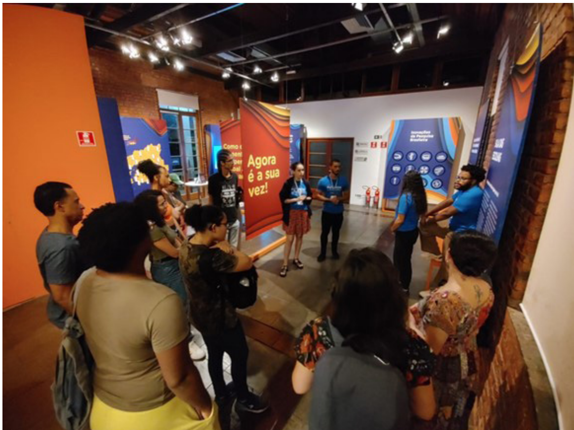
FIGURA 6 Mediação para um grupo na sala das escolas, durante a exposição Futuros da Baía de Guanabara: Inovação e Democracia Climática.

Para que essas conversas, tão caras à proposta da Casa, fossem promovidas, contamos com uma equipe de mediadores e mediadoras bolsistas e extensionistas, que atuaram como um elo entre a exposição e o público visitante, promovendo diálogos e instigando reflexões acerca dos temas da exposição. Com formação bastante diversa, a equipe contou com estudantes dos cursos de graduação de Relações Internacionais, Psicologia, Biologia, História da Arte, Fonoaudiologia, História, entre outros. A multiplicidade de olhares permitida por essa heterogeneidade de formações foi muito importante na construção da narrativa da exposição para com os variados os públicos, desde a educação infantil até o ensino superior, passando pela Educação de Jovens e Adultos, pessoas com deficiência, famílias, crianças, jovens, adultos, idosos, usuários do sistema de saúde mental do entorno da Casa, entre outros (Figura 6).