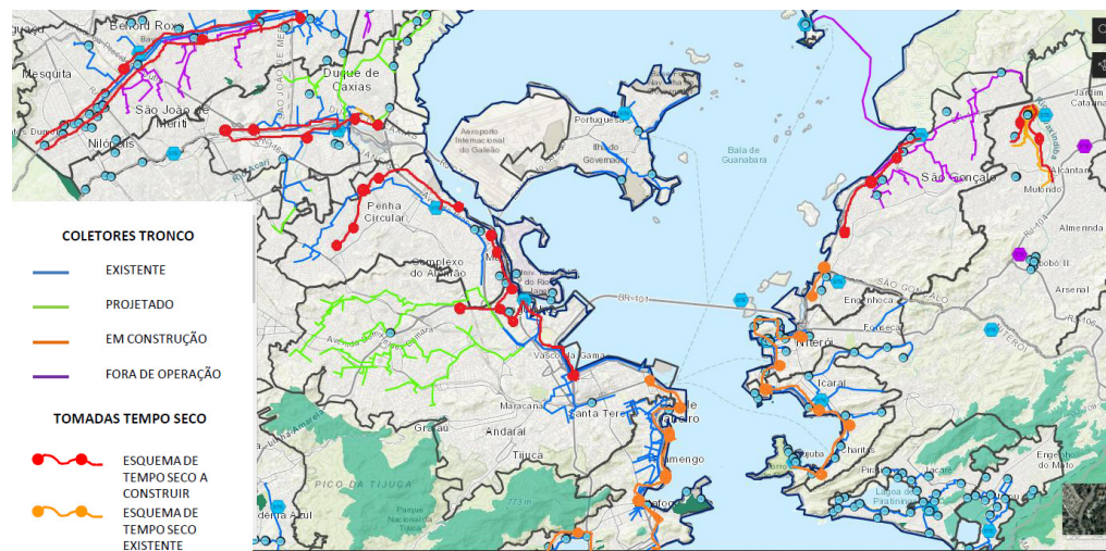
Figura 1. Em vermelho, representação esquemática dos cinturões de tempo seco propostos sobre mapa de troncos e ETAs existente

neste documento são consolidadas no termo “cinturão metropolitano da Guanabara”, bem como estima a sua capacidade de redução da carga orgânica lançada na Baía de Guanabara.