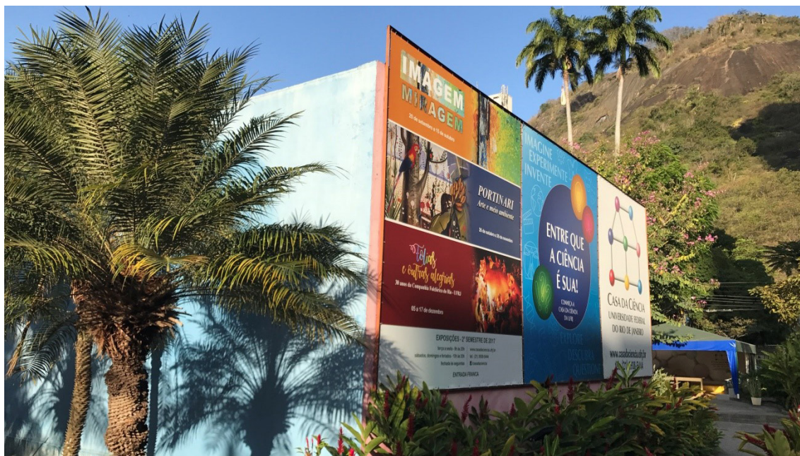
Figura 4 Instalações atuais da Casa da Ciência, Centro Cultural de Ciência e Tecnologia da Universidade Federal do Rio de Janeiro.

Diante de novas conjunturas trazidas pela década de 1990 para as universidades brasileiras, deu-se um novo sentido para esse espaço, institucionalizando-o como Casa da Ciência — Centro Cultural de Ciência e Tecnologia. Assim, em setembro de 1994, o Programa de Pós-Graduação em Engenharias do Instituto Alberto Luiz Coimbra de Pós-Graduação e Pesquisa de Engenharia (COPPE) submeteu a “Proposta de criação da Casa da Ciência — Centro Cultural de Ciência e Tecnologia da UFRJ”, com o propósito de criar um espaço de divulgação científica no campus da Praia Vermelha (Figura 4).