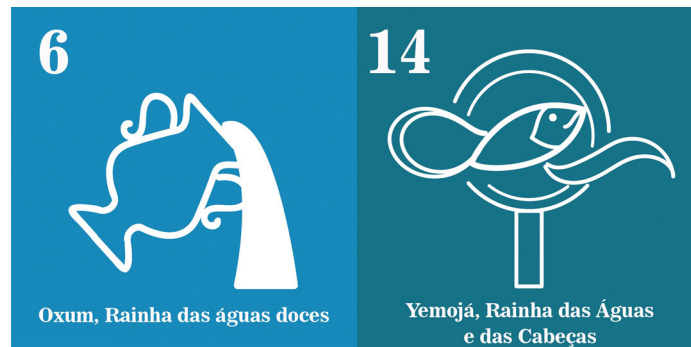
Imagens 2 e 3 - ODS dos Povos de Terreiro (site do Instituto Terreiro Sustentável https://ikt.bio/terreirosustentavel )

ganização das Nações Unidas (ONU), o Instituto Terreiro Sustentável, juntamente com 270 representantes potmas de todos o território brasileiro, organiza uma Agenda 2030 dos povos de terreiros traduzindo para uma linguagem tradicional as metas a serem alcançadas. As divindades Oxum e Yemoja representam em todos os seus princípios os ODS 06 (Água potavel e Saneamento) e o ODS 14 (Proteger a vida marinha), respectivamente. O reconhecimento dessa similaridade contribui para resgate dos saberes ancestrais, assim como o combate ao racismo religioso e ambiental.