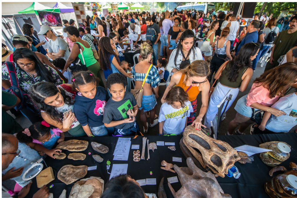
Figura 2 Atividade Científica “A Coleção didático-científica da SAE”

A estrutura do evento contou com duas tendas que abrigaram as 25 atividades científicas realizadas pelo corpo social do Museu Nacional/ UFRJ e uma para as atividades culturais. Também foram realizadas atividades externas, como visitas mediadas pela Quinta da Boa Vista, uma Roda de Conversa sobre subúrbios e periferias, e visitas ao Herbário, no Horto Botânico do Museu.