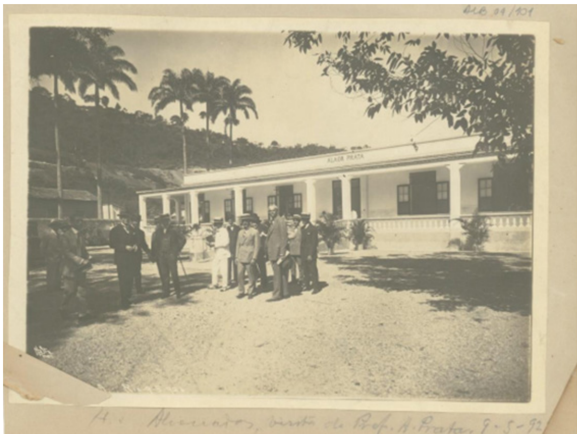
FIGURA 1 Edificação da Casa da Ciência, em fotografia de 1926 de Augusto Malta. Coleção Augusto Malta, Museu da Imagem e do Som, 1926.

As negociações e reformas de adaptação do antigo hospício e alguns de seus anexos para se tornar Universidade do Brasil e, posteriormente, Universidade Federal do Rio de Janeiro, levaram alguns anos. O PAP e seu entorno sediaram eventos e atividades de caráter educativo, tais como: o primeiro curso de dança moderna da época, ministrado pela professora Érica Sauer, e as Olimpíadas dos Servidores Públicos, em 1956. Atividades estas relacionadas a Escola Nacional de Educação Física e Desportos (ENEFD), mais tarde Escola de Educação Física e Desportos (EEFD) da UFRJ (Figura 3). Nas décadas seguintes, o Pavilhão continuou acolhendo diferentes atividades, principalmente as oficinas de colônia de férias para crianças da comunidade universitária e dos bairros vizinhos, e festas estudantis.