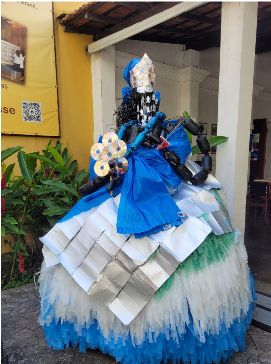
Imagem 1 - Escultura da Orixá Yemanjá confeccionada de materiais recicláveis (Terreiro Sustentável).

A água como fonte da vida e da existência da pessoa, segundo os Povos do Tronco Linguístico Yorùbá.