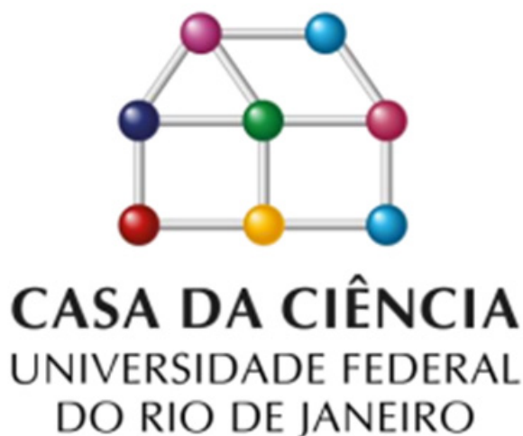
FIGURA 5 Logotipo da Casa da Ciência, centro cultural que realiza a popularização e difusão da ciência no âmbito da Universidade Federal do Rio de Janeiro.

Reformada em 1995, a casa (edificação) inspirou a identidade visual da instituição (Figura 5) e, acima de tudo, estabeleceu sua relação com o público visitante. A ideia central é a apropriação do conhecimento científico por meio da associação da ciência com o cotidiano das pessoas; criou-se, assim, um lugar para que o visitante se sentisse “em casa”.