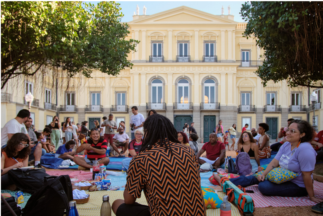
Figura 3 Atividade Científica “Roda de Conversa Um Museu feito de gente - diálogos sobre subúrbios e periferias”

As atividades científicas, propostas para público de todas as idades, envolveram jogos, pinturas, exposição e manuseio de peças do acervo, diálogos e manejo de instrumentos científicos. Podemos destacar a exposição de duas peças inéditas do Museu: o Meteorito de Santa Filomena e a escultura de representação de Xangô; a mostra de estrelas do mar e outros equinodermos vivos e secos; a apresentação de como ocorre uma expedição científica na Antártica, por meio de ferramentas, vestimentas e fósseis de animais e plantas que povoaram aquele continente há 90 milhões de anos, durante o período Cretáceo; e a exibição de peças arqueológicas que compõem o acervo do Museu, antes e depois do incêndio.